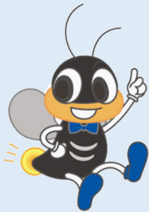
京都市上下水道局マスコットキャラクター ホテルの澄都(すみと)くん