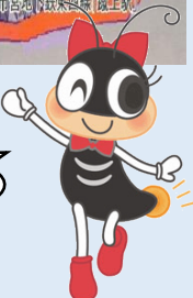
京都市上下水道局マスコットキャラクター ホテルのひかりちゃん