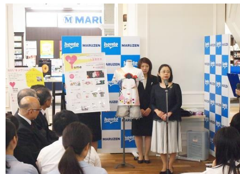
昨年度表彰式の模様: 応募実績 643 作品

報道各社におかれましては、ぜひ、広くご案内・取材いただきますようお願い申し上げます。