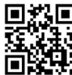
本学ホームページ

https://home.postanet.jp/PortalPublic/Identity/Account/Login?gkcd=012192