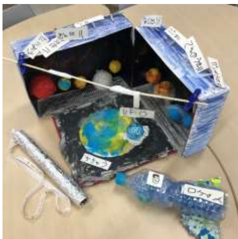
銀賞 「うちゅうだいぼうけん！なかをのぞいてみよう！」 幼稚園 藤尾 陽翔