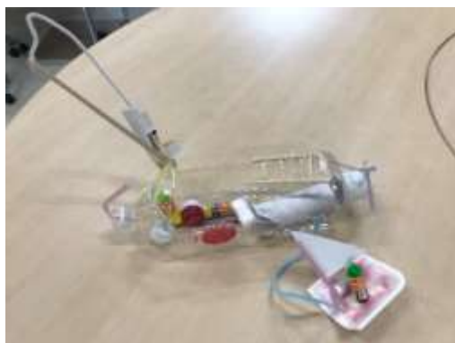
銅賞 「かいぞくせん」 幼稚園 三好 蔵之典