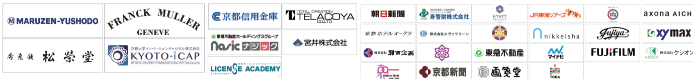
京都アカデミアフォーラム in 丸の内 新丸の内ビルディング10F