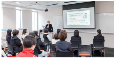
京都光華女子大学の全体説明会を聞こう