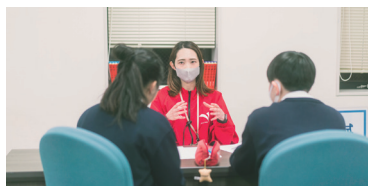
住まいの相談(オンライン) 気になる住まいのことを聞いてみよう！