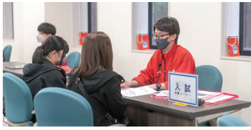
入試説明会に参加して 時期に合わせた入試の内容をチェックしよう！

その他気になることを個別で 相談することもできます。 どんなことでも相談ください。