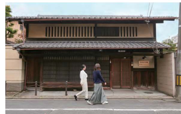
富小路町屋校園 富小路まちやキャンパス

また、本学には「富小路まちやキャンパス」があり、授業やイベントで京都文化が体験できます。京都の商店街や観光協会などとの連携プロジェクトも充実しています。