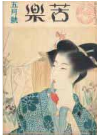
表紙「菖蒲湯」（鍋木清方画）