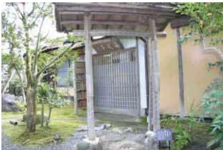
「石村亭」の離れ（書齋）