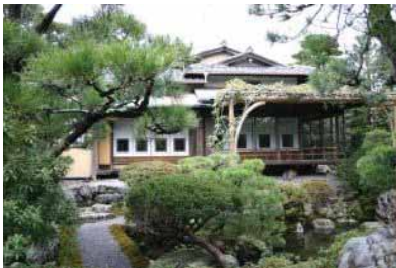
「石村亭」の庭と母屋