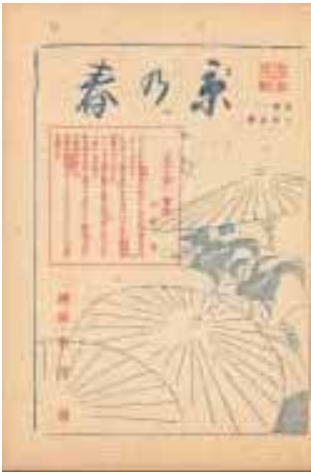
「京の春」中扉（上村松園画）